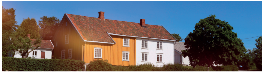
Museet Hauges Minde og Hauges fødehem.

Følg med på hjemmesiden hauges-minde.no og hauge2021!