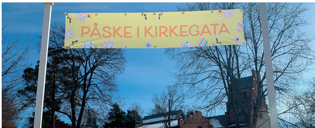
Portaler og banner – tanken bak var et ønske om at du skulle føle deg velkommen.