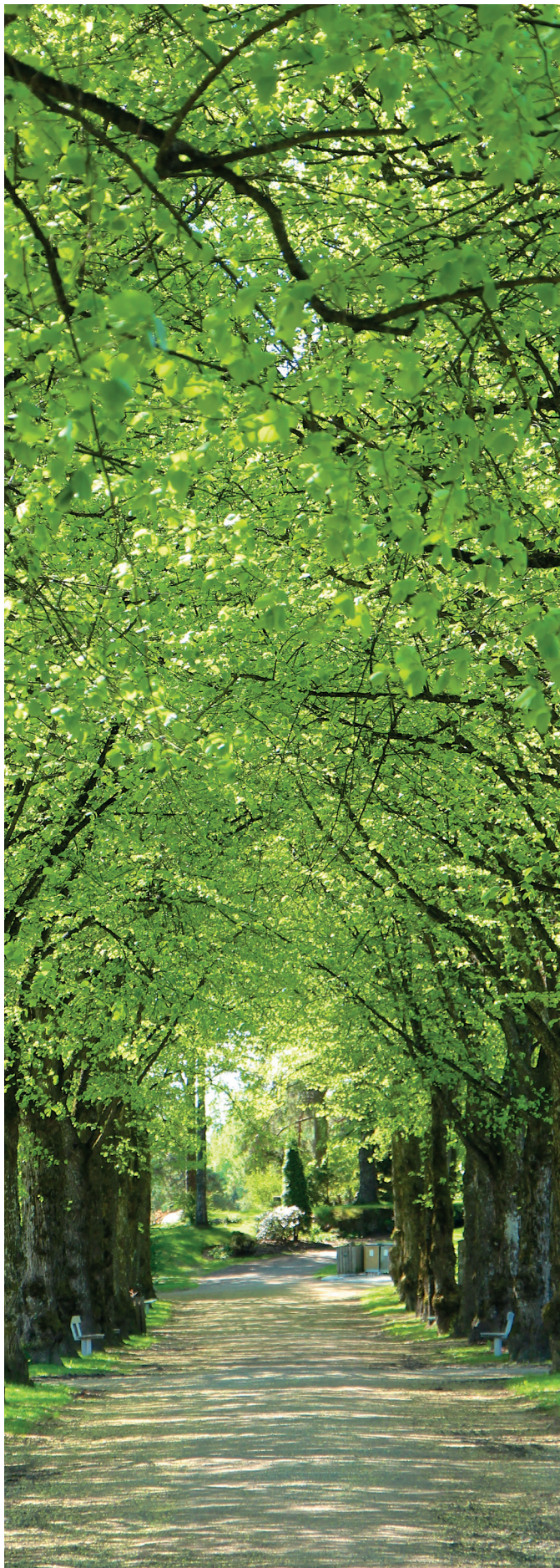
No livnar det i lundar