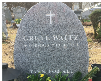
Grete Waitz Langdistanseløper