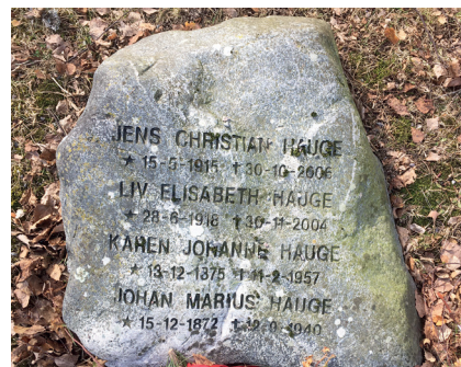
Jens Christian Hauge Milorgsjef, justisminister, industribygger