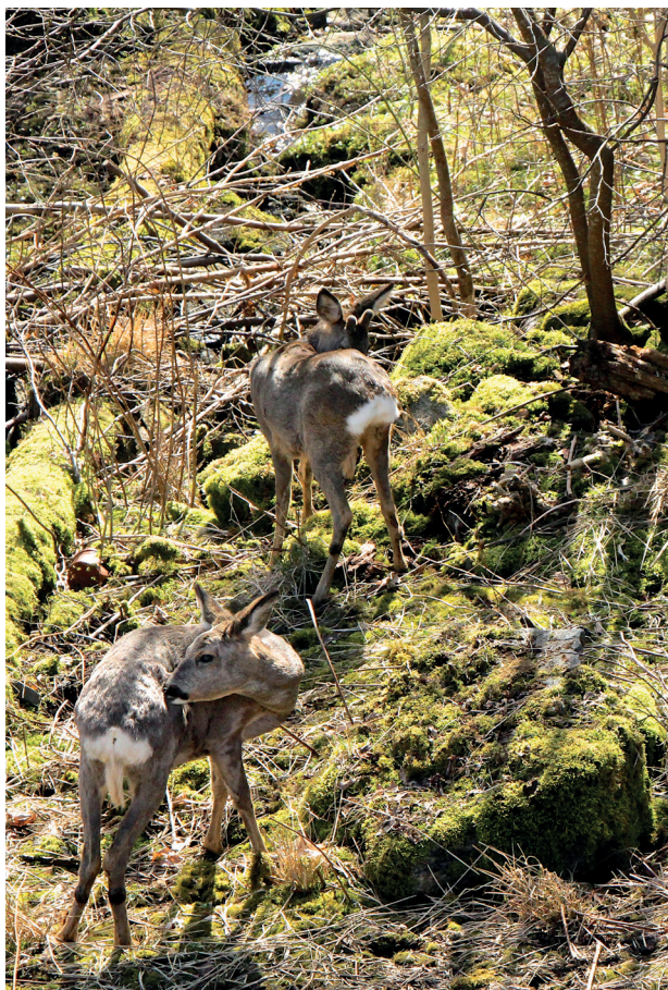
Livet er skjørt, men det livnar i lundar